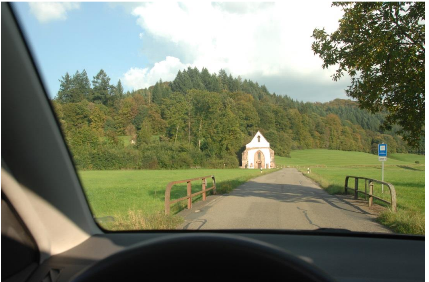
Emmendingen - Tennenbach; K 5138, Brücke, Kapelle