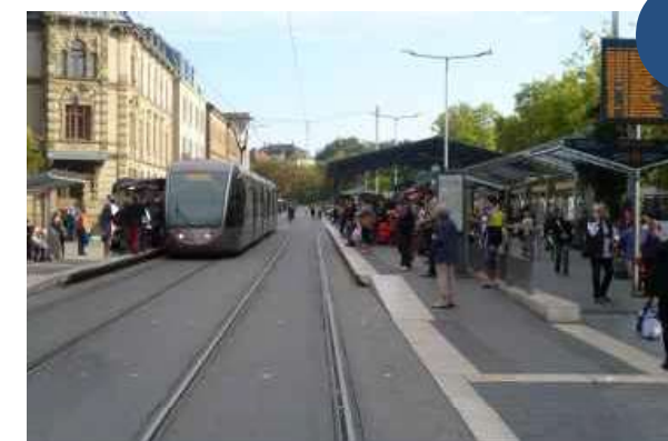
Fotomontage: Stadtbahnhalte am Zentralen Omnibusbahnhof (ZOB)

Aldingen wohnen, bequem und schnell in die Ludwigsburger Innenstadt zum Arbeiten, Einkaufen oder einfach nur zum Bummeln fahren. Wenn weniger Autos durch die Stadt fahren, profitieren davon auch die Passanten, Radfahrer und das Klima.