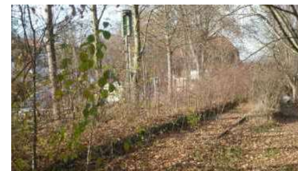
Der zugewachsene Möglinger Bahnhof

ministerium müsste der Autoverkehr in den Städten um ein Drittel reduziert und jedes dritte Auto elektrisch fahren, um bis 2030 die CO 2 -Emissionen um 40 Prozent zu senken. Der Klimawandel erfordert eine Verkehrswende und einen Ausbau des öffentlichen Verkehrs. Die Reaktivierung der Markgröningen Bahn wäre ein erster Schritt, auf dem Weg zu einer Stadtbahn. Aber es sollte schneller voran gehen.