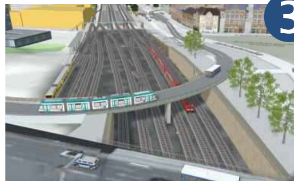
Fotomontage: Auf einer neuen Keplerbrücke könnte die Tram aus der Weststadt den ZOB erreichen. Auch Stadtbusse können diese Brücke nutzen, ohne im Stau zu stehen. Als Film: https://youtu.be/QJfm9XmRL6Y

Die Keplerbrücke ist das zentrale Bindeglied für die Verlängerung in die Innenstadt. Wer von Möglingen zu den Arbeitsplätzen in der Weststadt will oder wer von Markgröningen zum Marktplatz oder zum Klinikum möchte, muss nicht mehr am Bahnhof umsteigen, sondern kann einfach durchfahren. Von Remseck bis Markgröningen entsteht eine durchgehende Linie mit Anbindung an die S-Bahn. Das ist Anreiz für Autofahrer, das eigene Auto stehen zu lassen. Nur so gelingt die Verkehrswende!