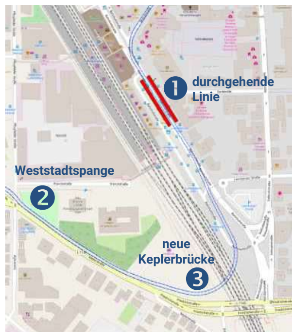
Skizze der Streckenführung mit einer neuen Keplerbrücke. Dadurch kann der Kreuzungsbereich Friedrichstraße/ Bahnhofstraße spürbar entlastet werden.

Gleichzeitig will die Stadt Ludwigsburg die Bus-Rad-Trasse (BRT) vom Osterholz durch die Innenstadt und weiter über Oßweil bis nach Neckargröningen bauen. Entgegen der früheren Planung von OB Spec handelt es sich dabei nicht mehr um die überlangen Busse, die auf einer Betontrasse durch die Stadt fahren, sondern um Stadtbusse, die auf Busspuren mit Bevorrechtung an den Ampeln zügiger voran kommen sollen. Wenn beide Vorhaben 2025 fertiggestellt sind, ist die erste Ausbaustufe erreicht, aber vom ursprünglichen Ziel, einer Stadtbahn im Landkreis Ludwigsburg, sind wir noch weit entfernt.