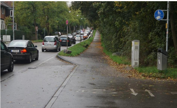
Am Kräherwald (MTV Zufahrt)

Es gibt nun eine vom Autoverkehr getrennte Radführung vom Pragsattel entlang der Stressemanstraße, weiter Am Kräherwald entlang über den Botnanger Sattel.