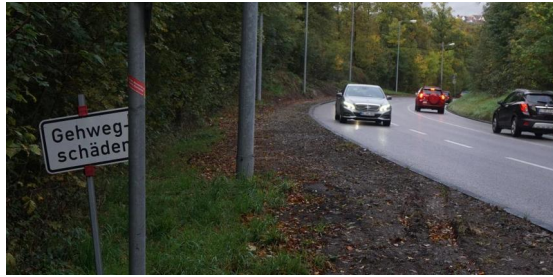
Neu Gehwegschäden beseitigt