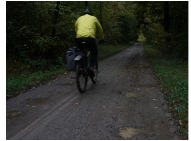
Wetzelsweg parallel zur Schnellstraße

Dazu können die nahe der Straße verlaufenden Forstwege genutzt werden, indem diese Splittwege asphaltiert werden. Wir schlagen vor, auf den ersten hundert Metern einen Rad- Fußweg dort zu bauen ,wo er vorher war ,um danach auf den Waldweg ca. 10 m neben der stark befahrenen Straße zu verschwenken. Vom Birkenkopf zum Forsthaus kann der Wetzelsweg asphaltiert werden.