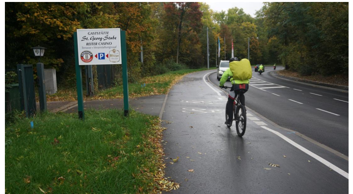
Gute Abschnitte Bettelweg und Geh- und Radweg Am Kräherwald