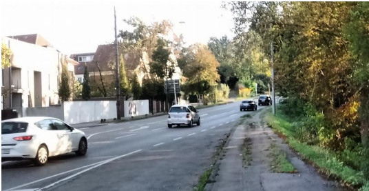
Alter Zustand mit Gehwegschäden

Der VCD Stuttgart fordert eine Weiterführung des Geh- und Radwegs außerhalb der Bebauung vom Botnanger Sattel entlang der großen Landstraße bis zum Forsthaus an der Wildparkstraße. Dazu sollten die neben der Straße liegenden Forstwege asphaltiert werden. Damit es auch in Stuttgart wie in umliegenden Landkreisen Rad- und Fußwege neben viel befahrenen Landstraßen gibt.