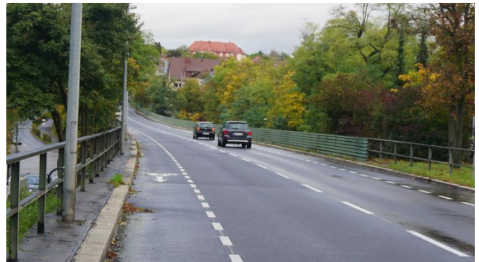
Radstreifen auf der Brücke über den Botnanger