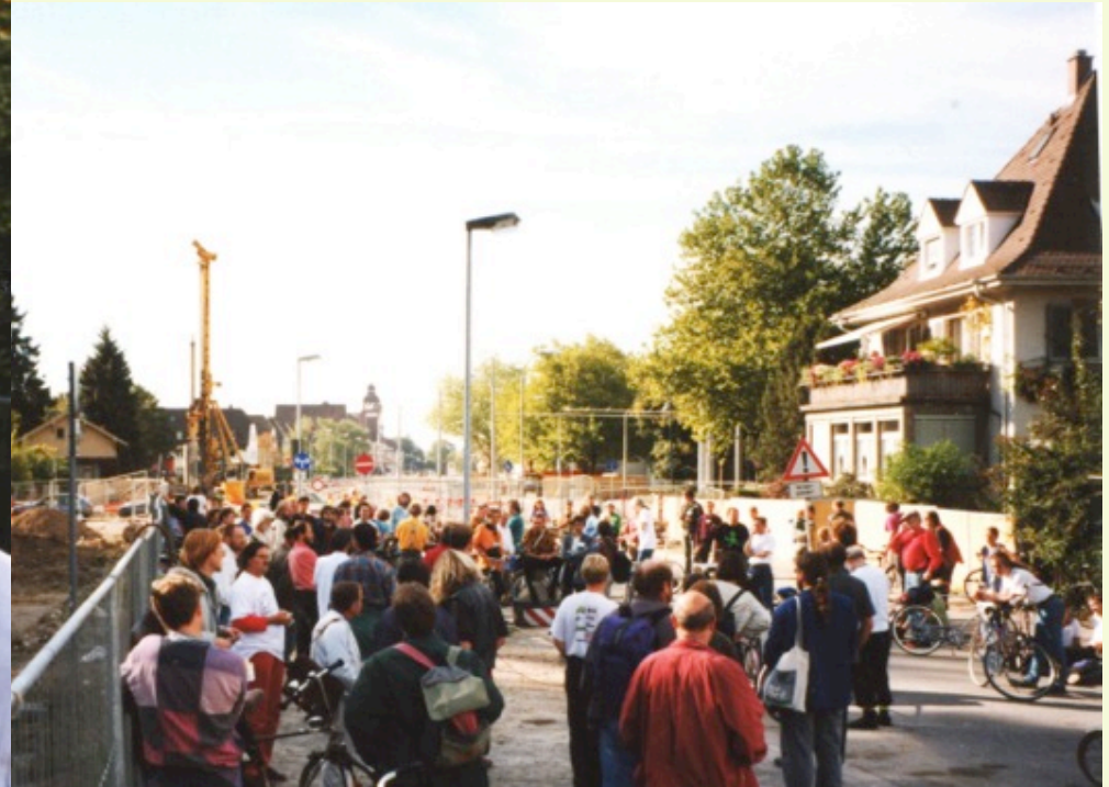
Bürgerinitiativen-Verkehrskongress in Freiburg