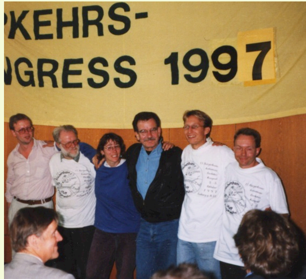
Bürgerinitiativen-Verkehrskongress in Freiburg