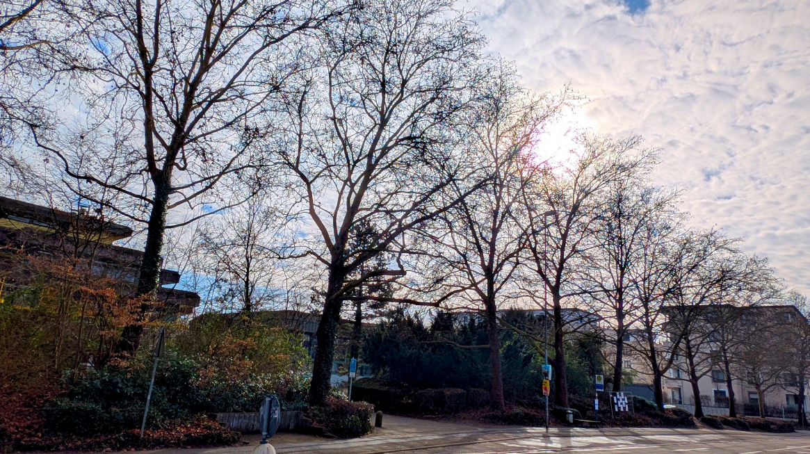
Standort für das geplante Parkhaus

Regierungspräsidium als zuständige Aufsichtsbehörde wurde zurückgewiesen: Es gibt keine rechtliche Einwände gegen die Planung.